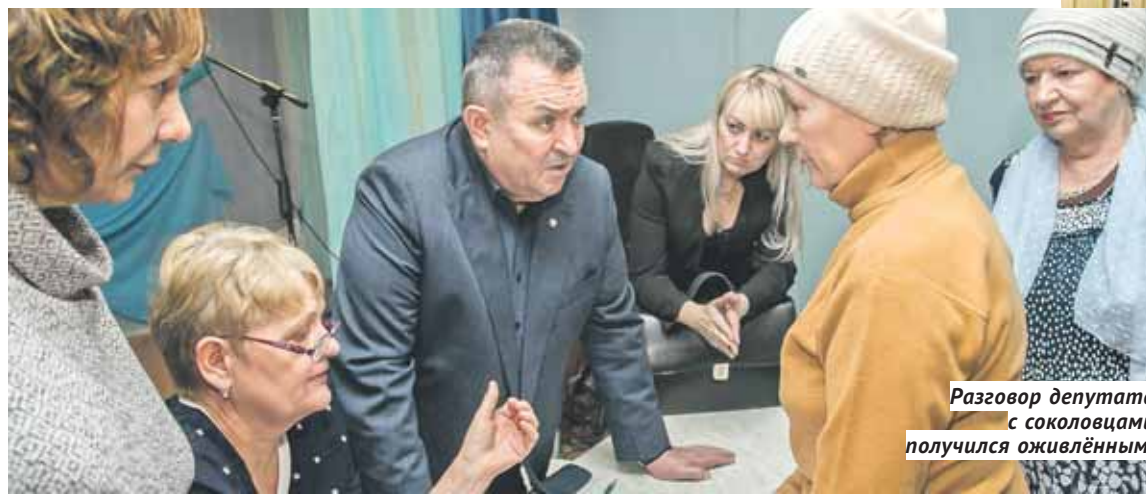
Разговор депутата с соколовцами получился оживлённым.

Вопросов к своему депутату у жителей тоже накопилось нема-