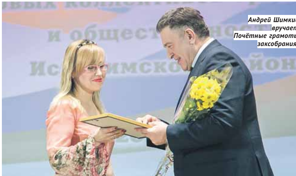
Андрей Шимкив вручает Почётные грамоты заксобрания.

Что касается сельского хозяйства, то объём его продукции составил 10,7 миллиарда рублей. Район нахо-