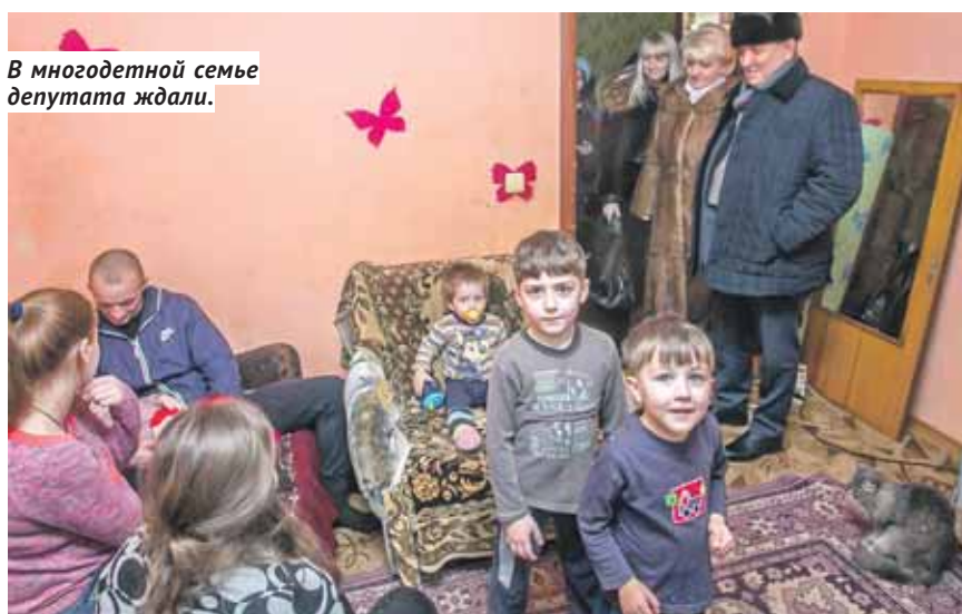
В многодетной семье депутата ждали.