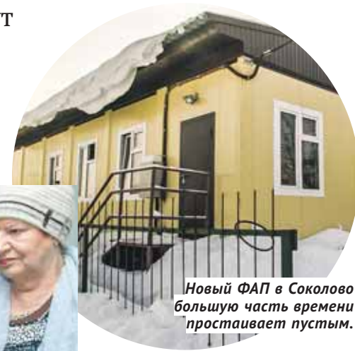
Новый ФАП в Соколово большую часть времени простаивает пустым.