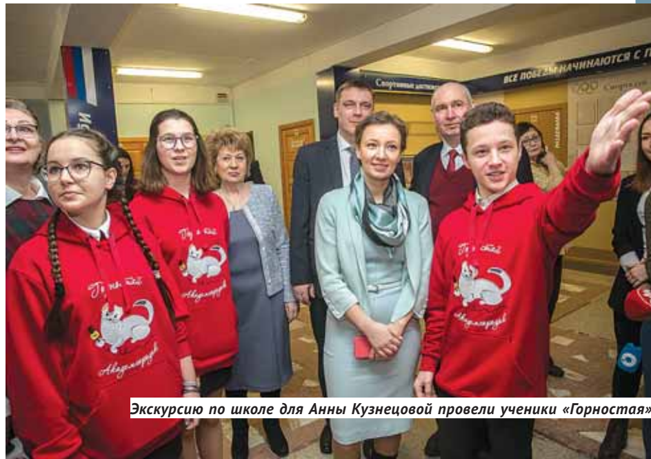
Экскурсию по школе для Анны Кузнецовой провели ученики «Горностая».

В областном центре социальной помощи семье и детям «Морской залив» Анне Кузнецовой рассказали о практике учреждения по социальной, психолого-педагогической и медицинской реабилитации семей с детьми с ОВЗ и детьми-инвалидами. Кроме того, был представлен опыт региона по дистанционному обучению